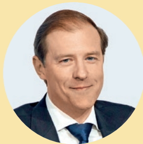
Денис МАНТУРОВ, первый заместитель Председателя Правительства РФ

“ Премия «Золотой Меркурий» — символ профессионального успеха и общественного признания, победа в конкурсе — показатель таланта и целеустремленности. От предпринимательской инициативы и эффективности во многом зависит конкурентоспособность российской экономики, привлечение инвестиций, создание рабочих мест, продвижение отечественных товаров и услуг, повышение качества жизни людей. Конкурс способствует решению этих задач, дает стимул для дальнейшего развития, реализации перспективных проектов.