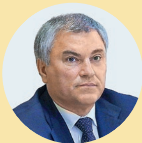
Вячеслав ВОЛОДИН, председатель Государственной Думы ФС РФ

“ Национальная премия «Золотой Меркурий» является частью большой и очень важной работы по поддержке предпринимательства в Российской Федерации. Инициативность, умение добиваться поставленных целей вопреки обстоятельствам и противостоять вызовам времени — качества, присущие победителям и лауреатам премии и необходимые для обеспечения стабильного экономического развития России. Хочу особо отметить предприятия, которые в столь непростое время смогли перестроить свою работу, найти новые решения и подходы к ведению бизнеса. Ваши достижения должны послужить примером для делового сообщества. Убеждена, что победа в конкурсе — заслуженная награда за упорный труд, мотивирующая на движение вперед.