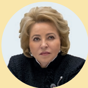
Валентина МАТВИЕНКО, председатель Совета Федерации ФС РФ

“ Национальная премия «Золотой Меркурий» является частью большой и очень важной работы по поддержке предпринимательства в Российской Федерации. Инициативность, умение добиваться поставленных целей вопреки обстоятельствам и противостоять вызовам времени — качества, присущие победителям и лауреатам премии и необходимые для обеспечения стабильного экономического развития России. Хочу особо отметить предприятия, которые в столь непростое время смогли перестроить свою работу, найти новые решения и подходы к ведению бизнеса. Ваши достижения должны послужить примером для делового сообщества. Убеждена, что победа в конкурсе — заслуженная награда за упорный труд, мотивирующая на движение вперед.